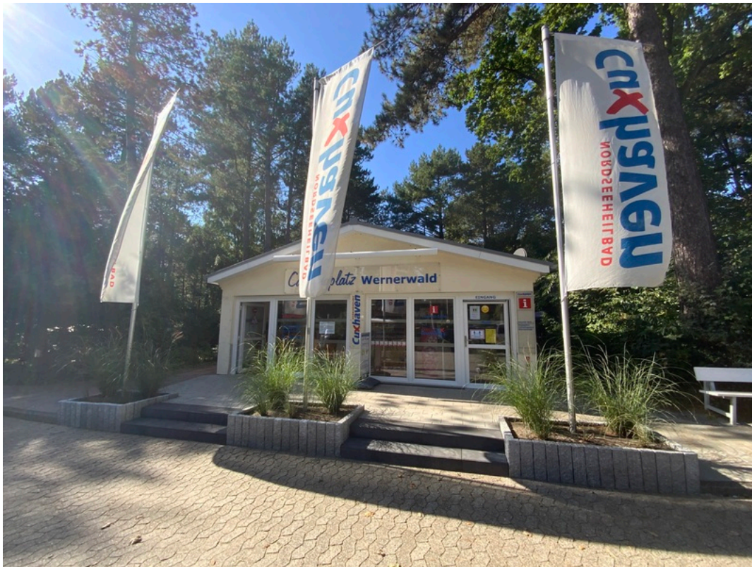
Tourist-Information Sahlenburg