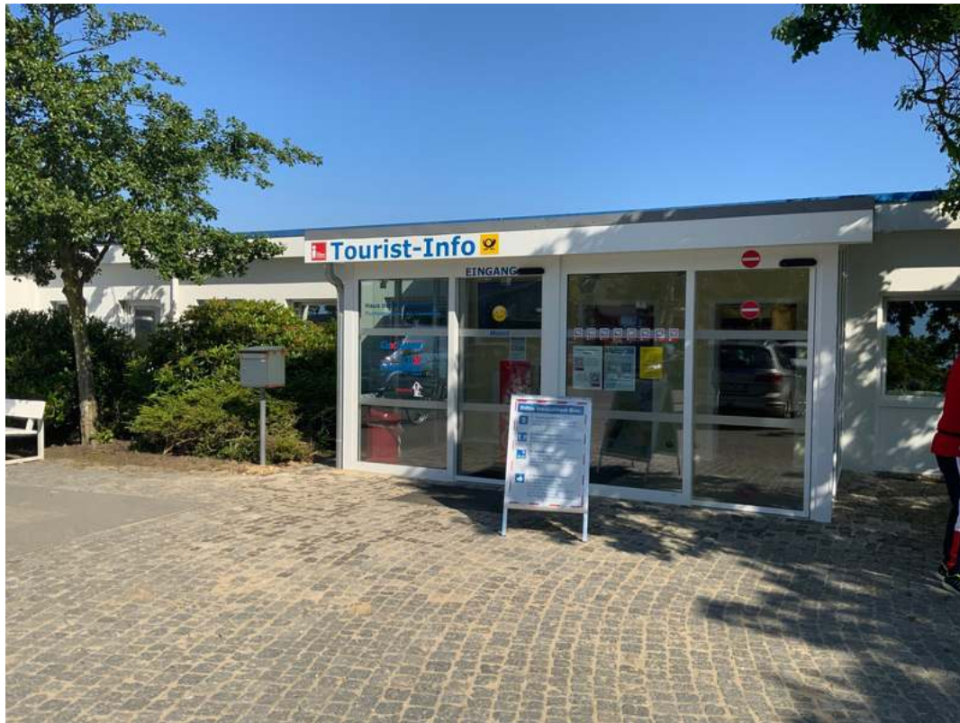
Touristinformation Duhnen | ©Guido Frank